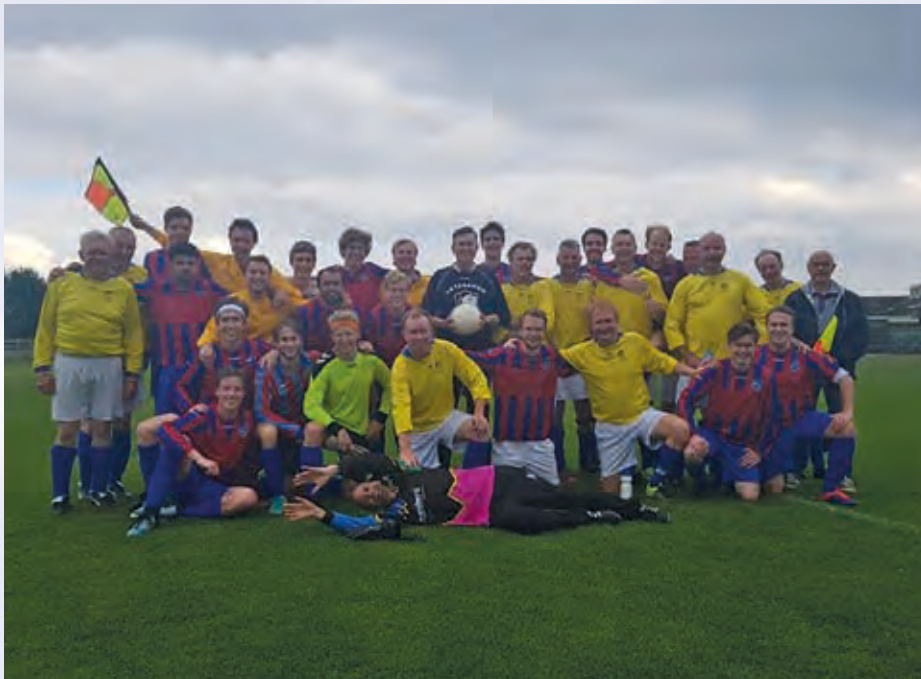
Veteranen voorjaar 2019