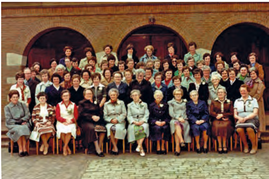
De leden van Boerinnenbond/KVO-Sambeek, die in 1978 hun 40-jarig bestaan vierden.

Oproep in een regionale krant in 1938 om naar de oprichtingsvergadering van de Sambeekse Boerinnenbond te komen.