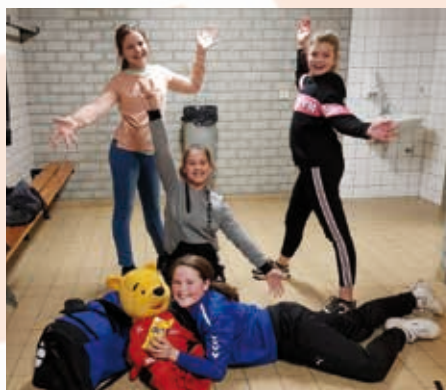
Mini's niveau 5