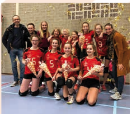
Dames Aspiranten C1