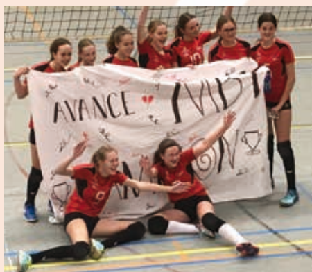
Dames Aspiranten B1

Natuurlijk nodigen wij iedereen van harte uit om een keer een kijkje naar de prestaties van onze teams te komen kijken. Tot ziens in de Warandahal.