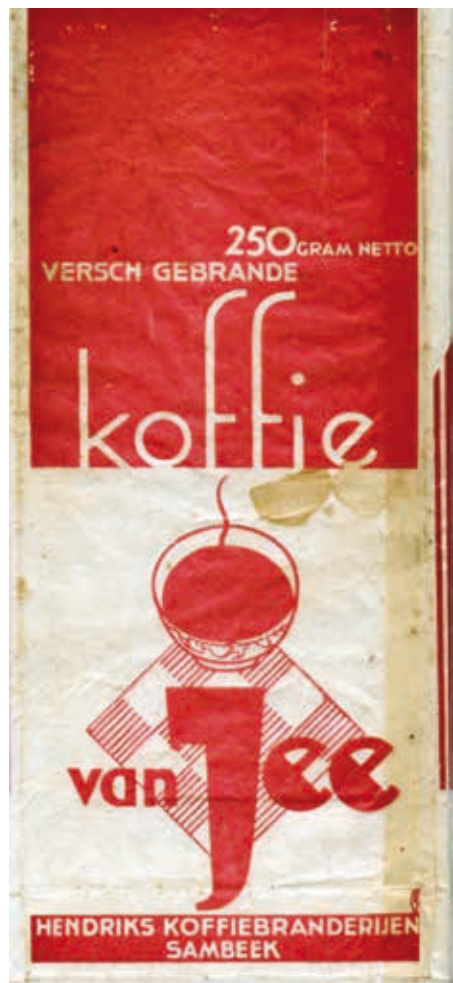
Het enige bewaard gebleven koffiezakje van Van Jee.

's nachts meende men het vuur meester te zijn, maar tegen half zes 's morgens werd de brandweer wederom gealarmeerd en nu voor de magazijnen, waar het vuur hevig oplaaide. Ofschoon ook nu de brandweer spoedig verscheen, kon men echter niet voorkomen dat ook dit gedeelte geheel uitbrandde." De schade was niet gering: de gehele koffiebranderij mét machines ging verloren. De oorzaak van de brand is nooit achterhaald.