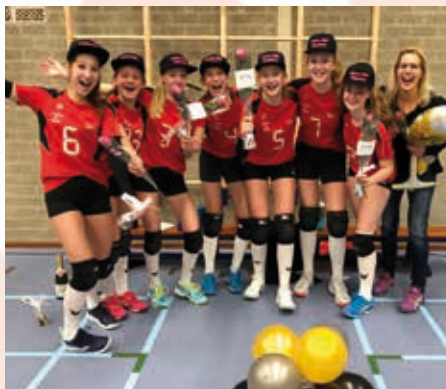
Dames Aspiranten B3