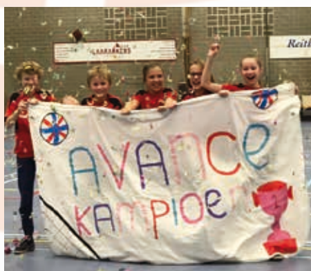
Mini's niveau 4